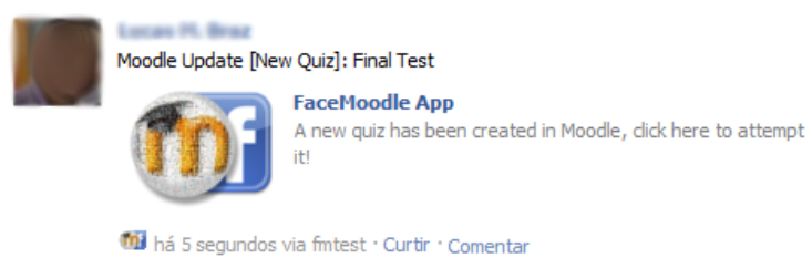
Figura 3. Publicação no mural do estudante informando que um questionário foi criado.

A publicação mostrada na Figura 3 contém um link , por meio do qual o estudante é redirecionado para uma página da Aplicação Web onde ele poderá responder ao questionário em uma interface semelhante à do Moodle, porém permanecendo no ambiente do Facebook.