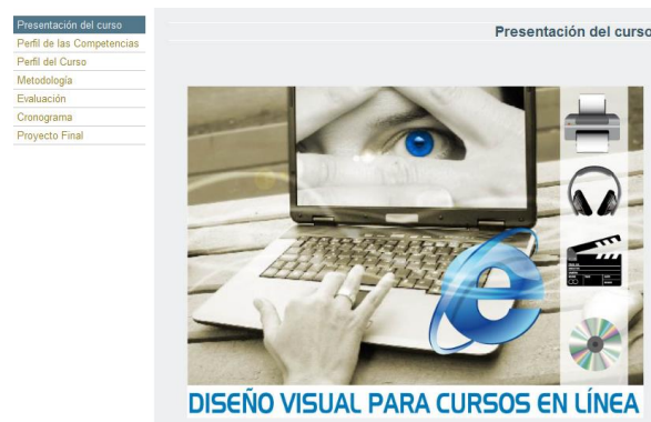
Fig. 3. Diseño visual de la guía didáctica de un curso virtual.

Lo antes mencionado nos lleva a indicar que el propósito fundamental de la guía didáctica es el de ubicar al participante en el contexto del curso para darle una visión panorámica de éste y orientarle sobre qué se espera lograr al final de la experiencia, cuál será su papel y cómo intervendrá el tutor durante todo el proceso. (Ver Fig. 3).