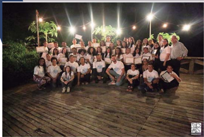
Miembros participantes de la Academia.

La iniciativa de seguir realizando esta academia es un sentir latente entre cada uno de sus organizadores, por lo que invito a todos los lectores a estar pendientes y se animen a... ¡participar!