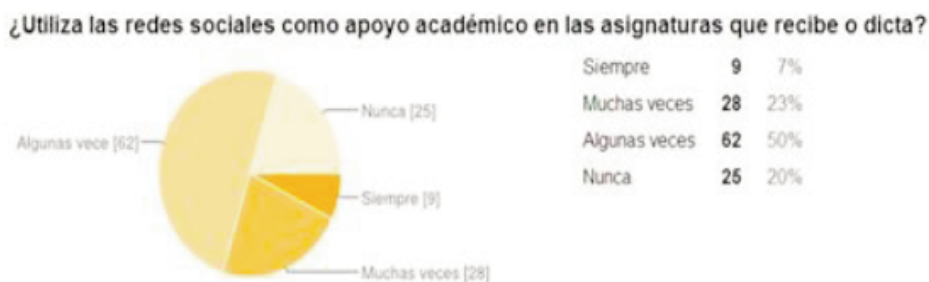
Figura 4. Utiliza las Redes Sociales como apoyo académico.

Es aquí el punto que tanto las instituciones educativas como los docentes que pertenecen a ellas, deben aprovechar para orientar a los jóvenes sobre el aprovechamiento de las redes sociales, no sólo con fines sociales y de entretenimiento sino en una implementación de carácter educativo. Nos apoyamos además en que, para la mayoría, las redes sociales como tal, son importantes y, en la respuesta que nos ofrecen cuando un 80% indican que siempre, muchas veces y algunas veces la utilizan como apoyo académico como se puede apreciar en a figura 4.