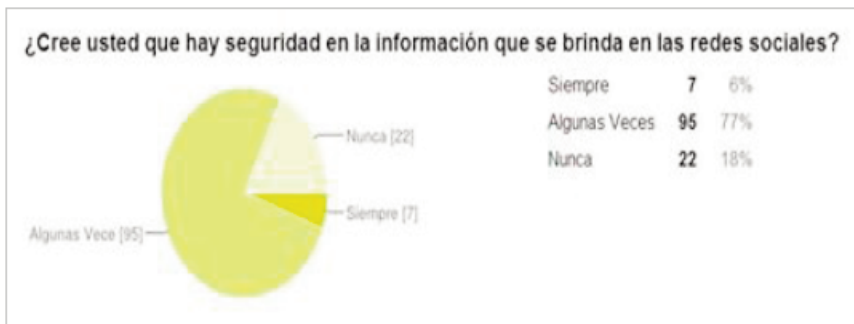
Figura 1. Clasificación por Estamento.

Al analizar los datos obtenidos de la encuesta nos encontramos con los siguientes resultados. En términos generales, el 56% de los encuestados está en edades de 18 a 25, el 23% corresponde a las edades de 26 a 40, el 19% para más de 40, mientras que únicamente el 2% corresponde a menores de edad. En total, un 61% corresponde al sexo masculino y un 39% corresponde al sexo femenino. Cabe señalar que la mayoría de los encuestados representa al sector estudiantil en un 72%, seguido del sector docente en un 23% y finalmente los administrativos en un 5%, como se puede apreciar en la Figura 1.